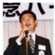
佐方青年部会長御礼挨拶