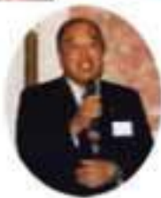
司会 神崎東部地区 部会長