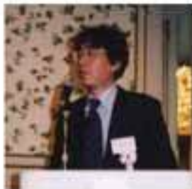
平子副理事長 協会代表 (技術委員長)

第一部では「スパイラル巻紙管人生五十年を振り返り」で紙管に携わった経緯から現在に至るまで、新製品開発の内容など、第二部では「スパイラル巻紙管技術論」について紙管の巻き方、紙管を巻く上での重要な考え方等、普段組合員の巻く様が日常的に行っている作業の基本的なものを改めて認識させて頂いたお話をしました。