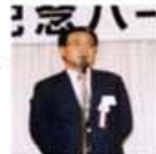
赤榮副理事長御礼挨拶