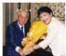
高木事務局より花束贈呈