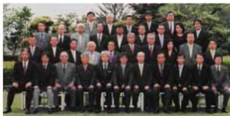
全国紙管工業組合 第41回通常総会 平成19年5月17日 於 有馬グランドホテル

去る五月十七日神戸市有馬温泉「有馬グランドホテル」におきまして、当組合第四十一回通常総会を開催致しました。総会におきましては、組合員五十七社（内委任状出席二十五社）の出席を得まして、平成十八年度収支決算書、平成十九年度事業計画案・収支予算案、定款変更（別紙）の件を審議の結果、全議案が原