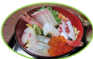
やぶ新橋店の海鮮丼