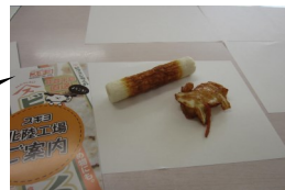
スギヨのちくわと加賀揚げ